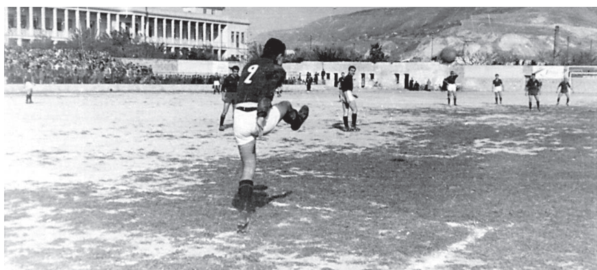
Tre immagini del Campo Aula nella seconda metà degli anni Quaranta. In alto il pubblico assiste alla partita sistemato anche davanti agli spogliatoi; in quella centrale la gente segue la gara pure dalla caserma dei Vigili del Fuoco; in basso si notano la tribuna non ancora coperta e un accenno di ...manto erboso