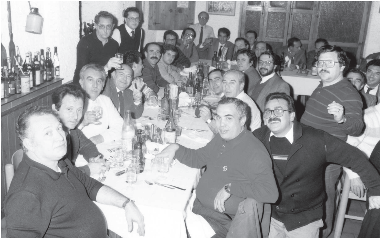
Dopo la fusione fra Trapani e Pro Trapani, si guarda con grande fiducia al futuro del sodalizio granata