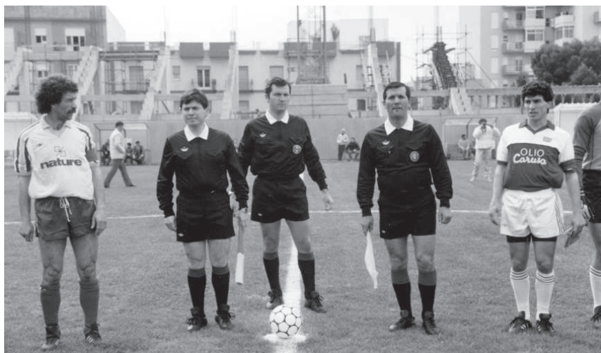
1986: lo stadio con la tribuna coperta in costruzione