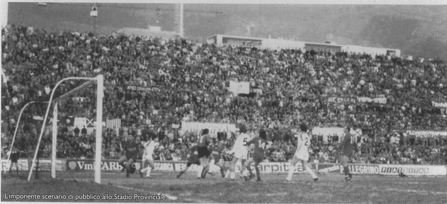
L'imponente scenario di pubblico allo Stadio Provinciale